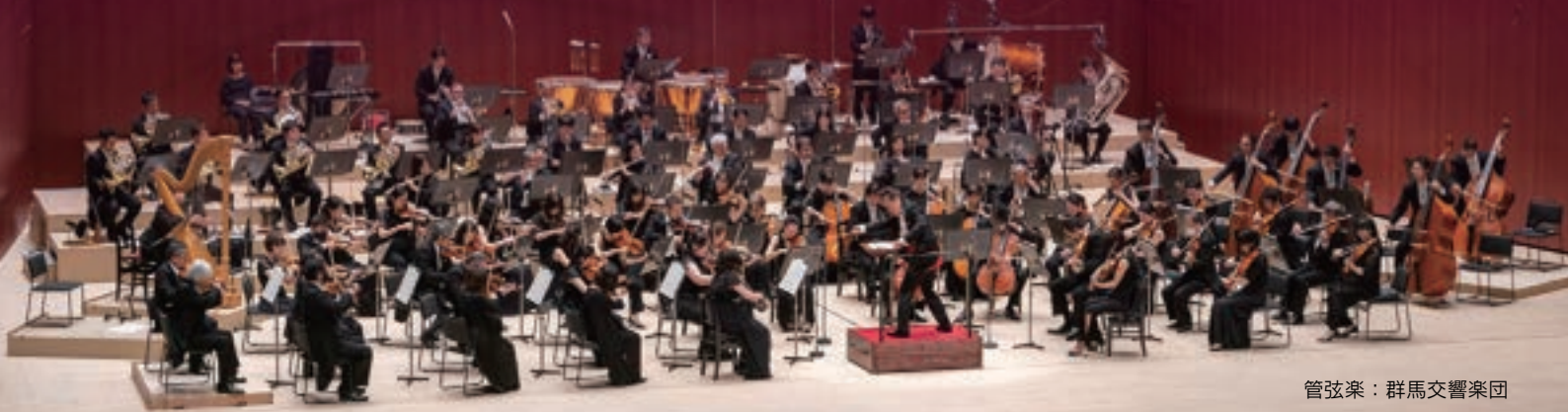
管弦楽：群馬交響楽団

※新型コロナウイルス感染拡大防止につとめコンサートを開催いたします。会場内では、常時マスク着用、手指消毒のご協力をお願いいたします。入場前に検温を実施します。(37.5℃以上のお客様はご入場をご遠慮いただきます。)